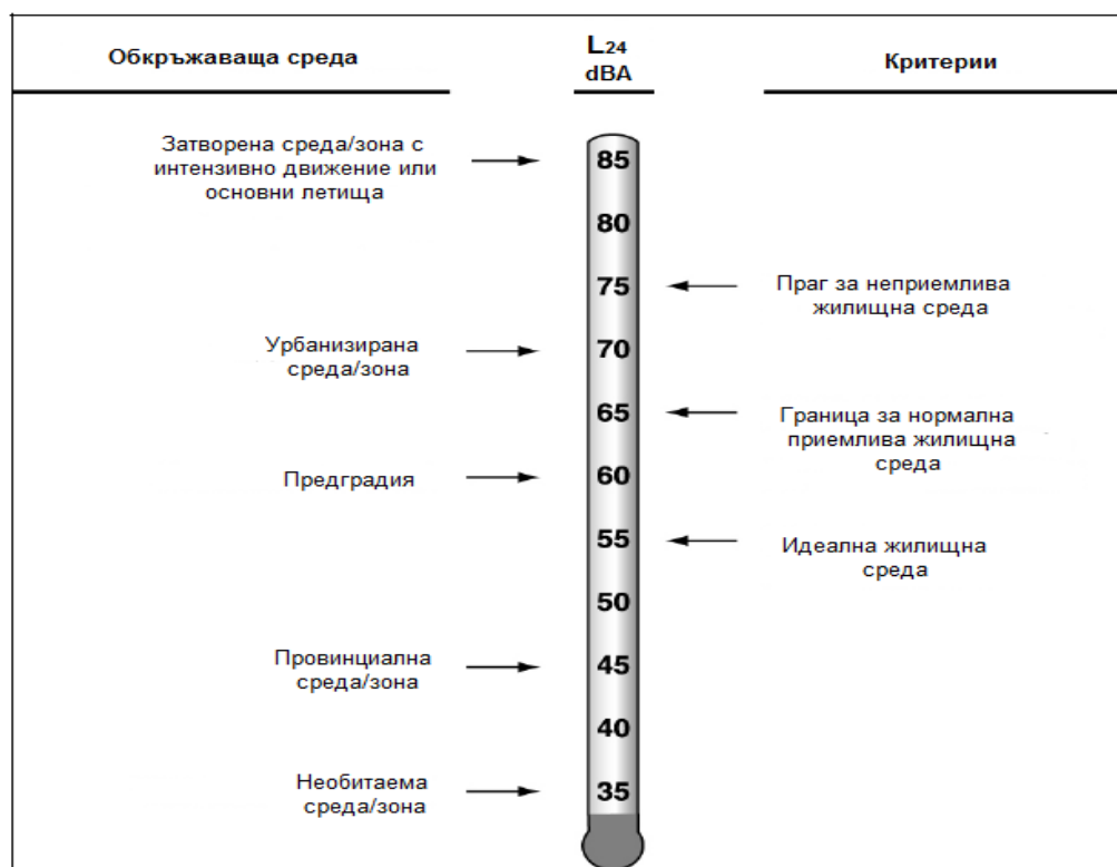
Фигура № 1.1.2.1-1. Препоръчителните критерии за дискомфорт, на база денонощното ниво на шума ( L_{24} ).

На следващата фигура са представени препоръчителните критерии за дискомфорт, на база денонощното ниво на шума ( L_{24} ).