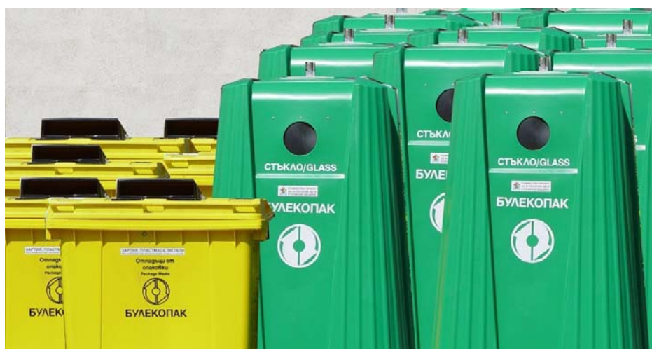
Фиг.№ 2 Външен вид на контейнерите за разделно сметосъбиране

Разположението на съдовете за разделно събиране е определено от Кмета на общината и е съгласувано с Булекопак АД. То е съобразено с изискванията на Министерството на